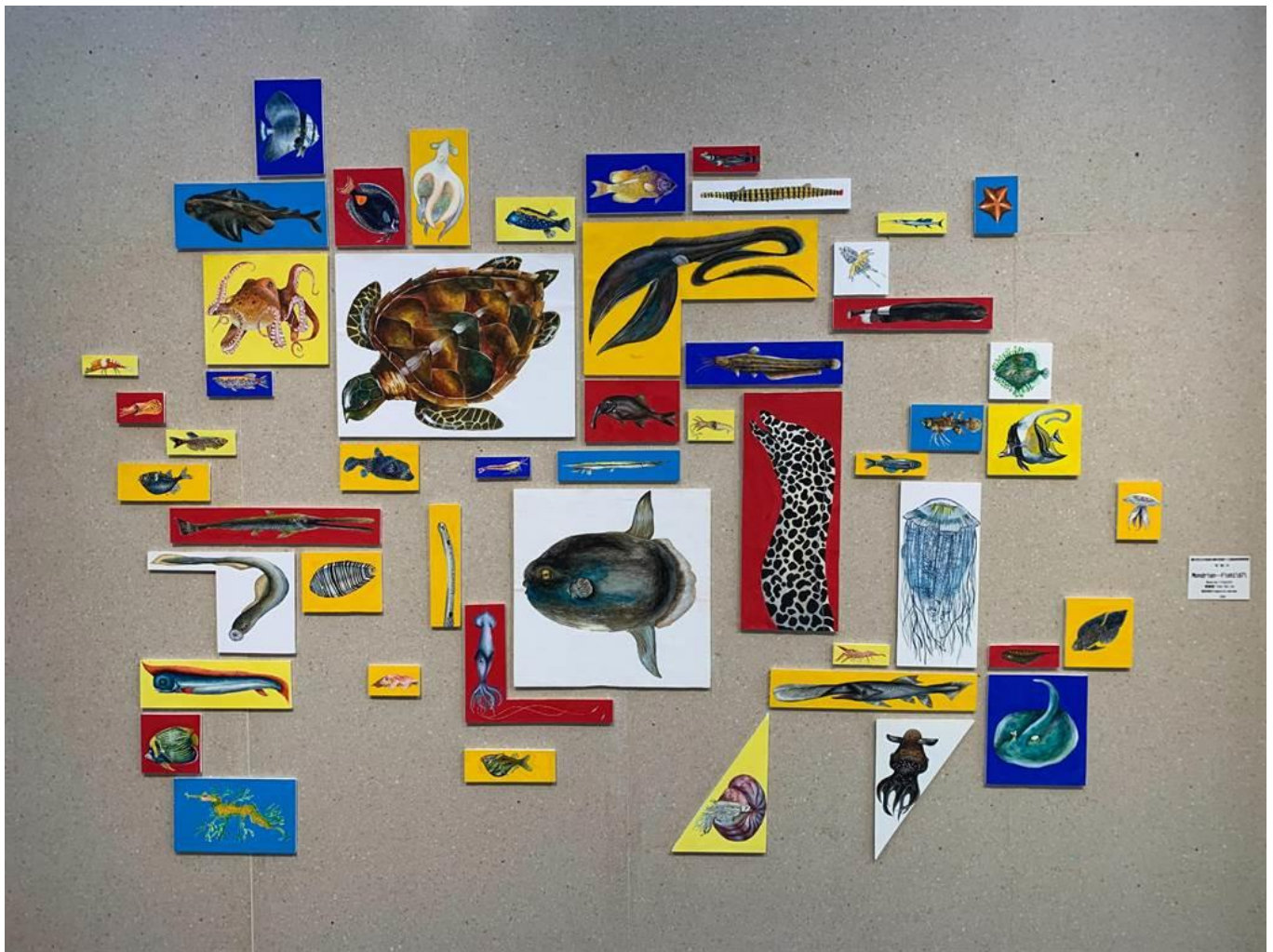
中港高中國中部美術班畢業展 16 日於港區藝術中心登場。