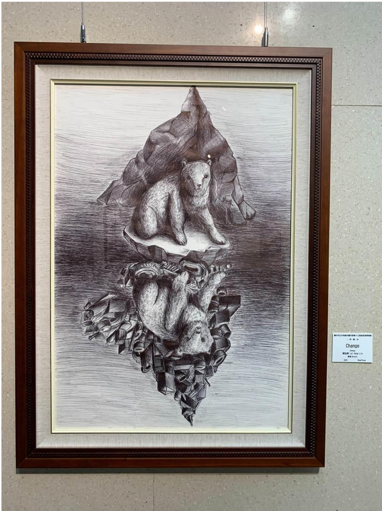
中港高中國中部美術班畢業展 16 日於港區藝術中心登場 — 藝 · 界 — Change Change 繪畫家 Lay Hong Lin 展覽日期 2023 10/14-16