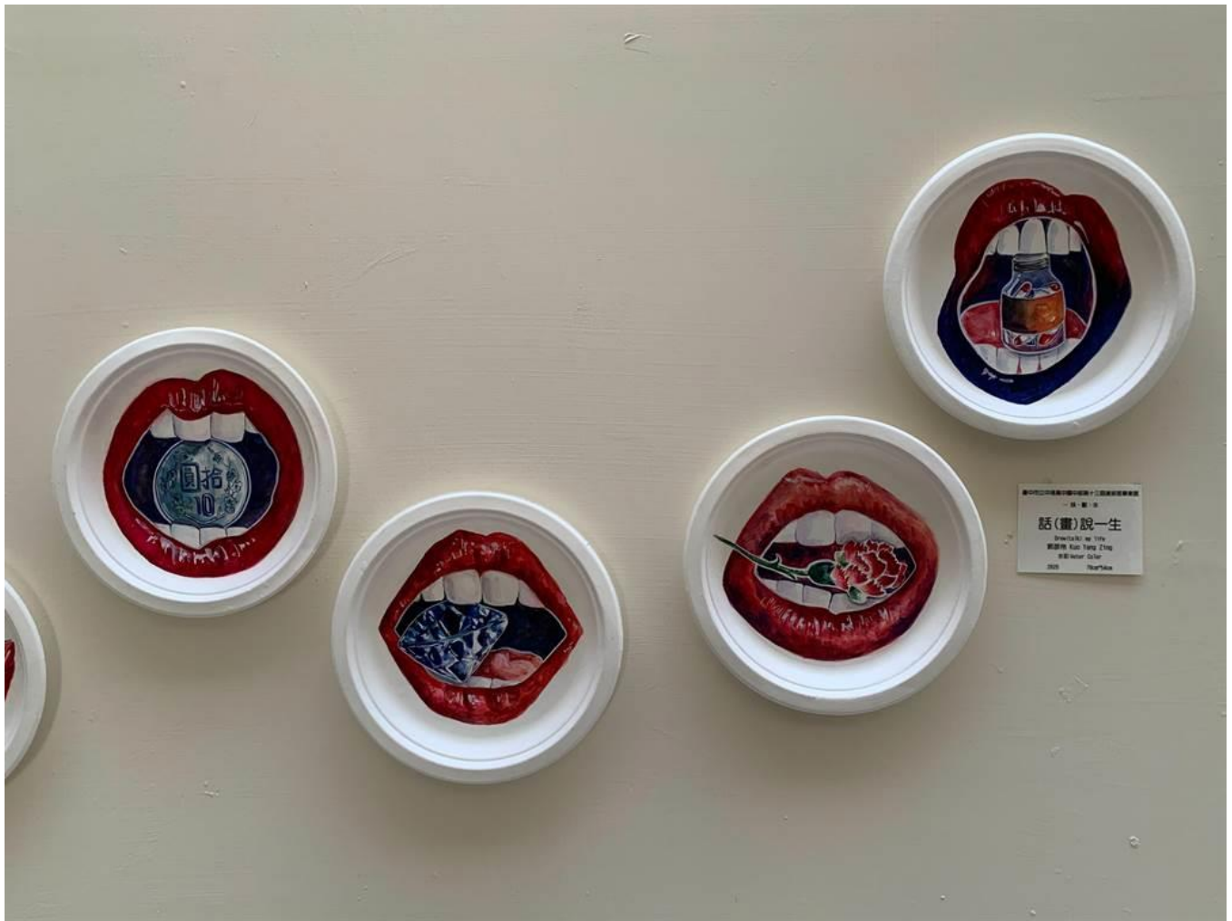
中港高中國中部美術班畢業展 16 日於港區藝術中心登場。