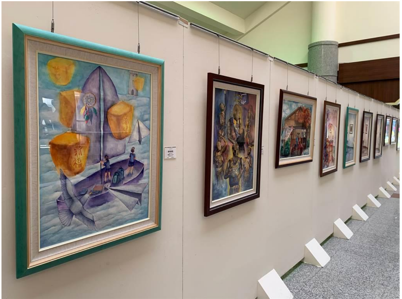
中港高中國中部美術班畢業展 16 日於港區藝術中心登場。