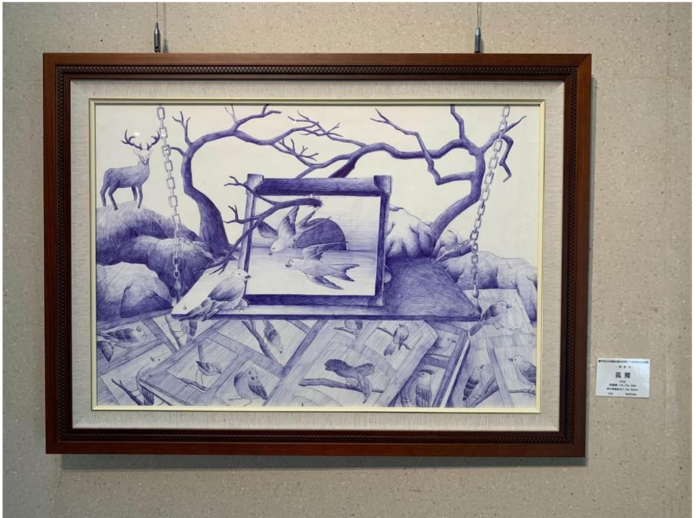
中港高中國中部美術班畢業展 16 日於港區藝術中心登場。