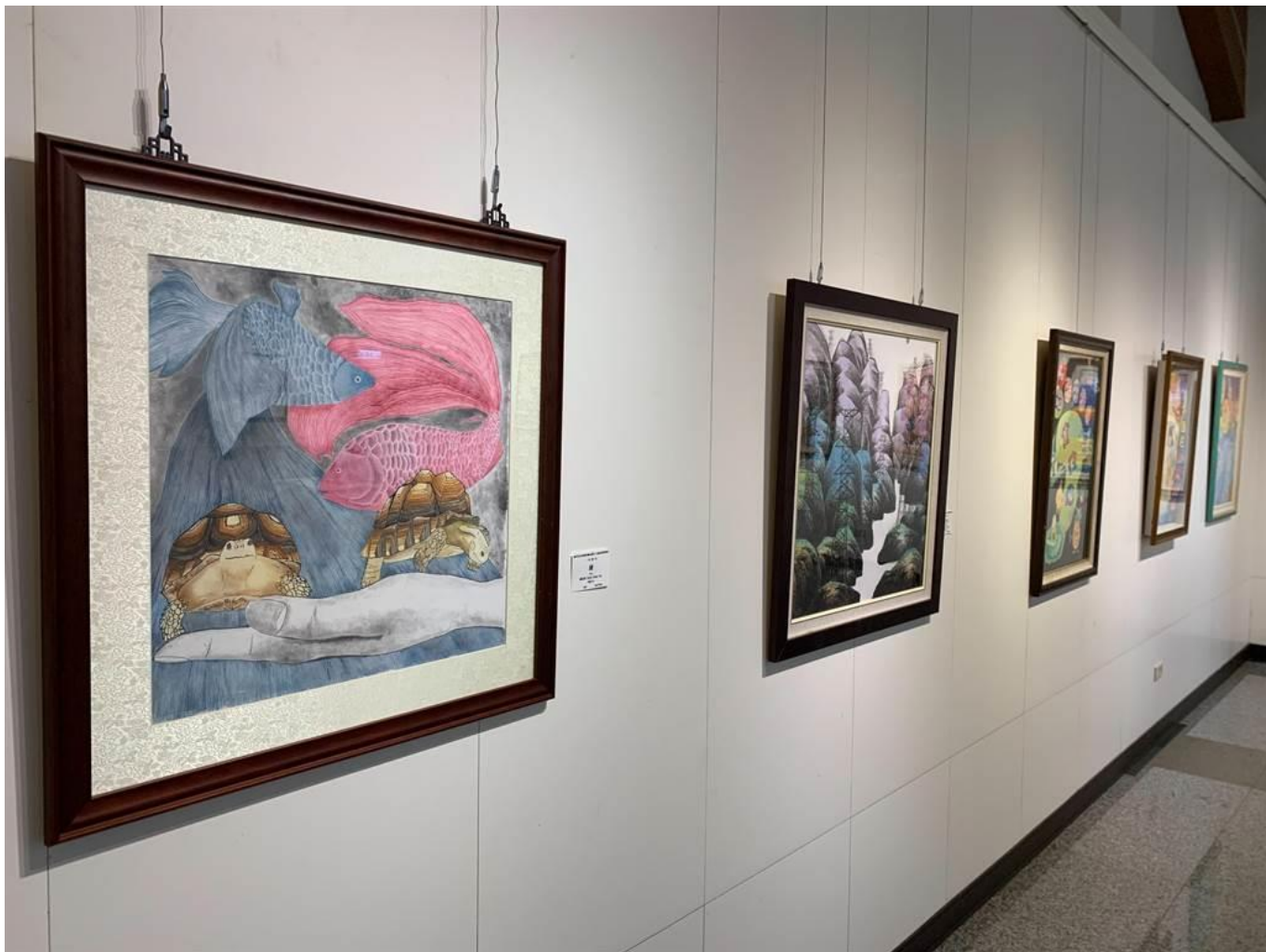
中港高中國中部美術班畢業展 16 日於港區藝術中心登場。